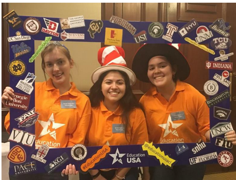
Universidades estadounidenses presentes en una feria universitaria en Chile para estudiantes chilenos que desean estudiar en EE. UU.